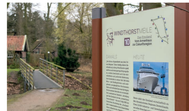
Station 10, Standort: LWH-Garten