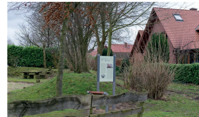
Station 8, Standort: Spielplatz Werner-Remmers-Patt