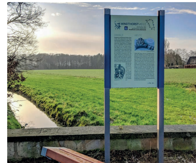
Station 6, Standort: Im Kamp Hoog