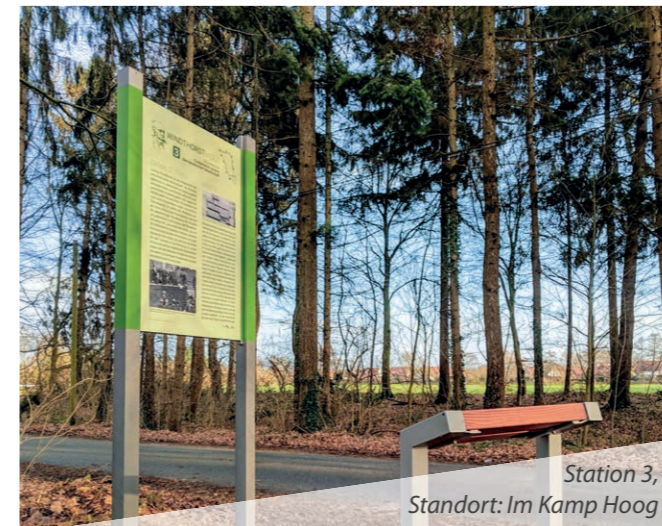
Station 3, Standort: Im Kamp Hoog

Ein Themenpfad auf politischen Spuren aus drei Jahrhunderten