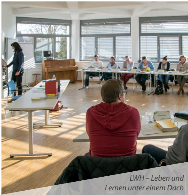
LWH – Leben und Lernen unter einem Dach